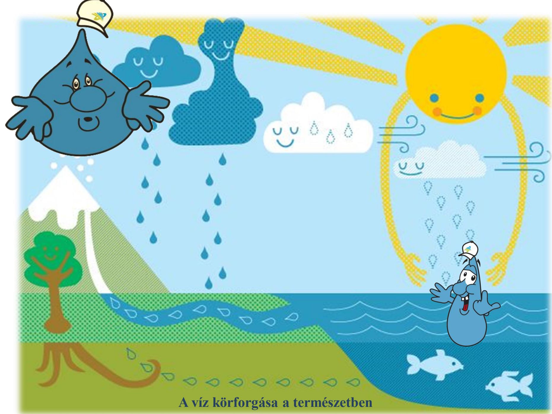
A víz körforgása a természetben